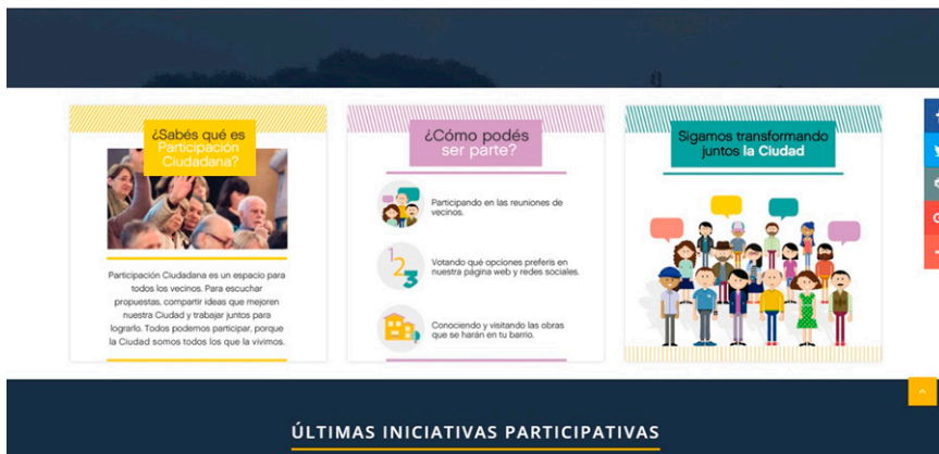
Figura 3. Página de inicio del sitio web de Buenos Aires Participación Ciudadana.