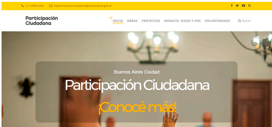
Figura 1. Página de inicio del sitio web de Buenos Aires Participación Ciudadana.

En cuanto al formato de la página web, presenta en el inicio una imagen principal en movimiento hacia afuera y hacia adentro (zoom in/zoom out) que va variando y un texto que cae sobre la imagen: “Buenos Aires Ciudad. Participación Ciudadana. ¡Conocé más!”. Más abajo, hay un link hacia la “agenda semanal” y por debajo cuatro textos informativos con los títulos “Vecinos participando”, “¿Sabés qué es Participación Ciudadana?”, “¿Cómo podés ser parte?” y “Sigamos transformando juntos la Ciudad”. Por último, aparece una pestaña llamada “Últimas iniciativas participativas” y, en la parte inferior de la página, nuevamente la información de la página principal, los accesos directos y los contactos.