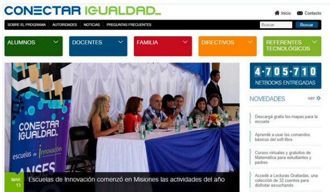
Figura 4. Página de inicio del sitio web del Programa Conectar Igualdad.