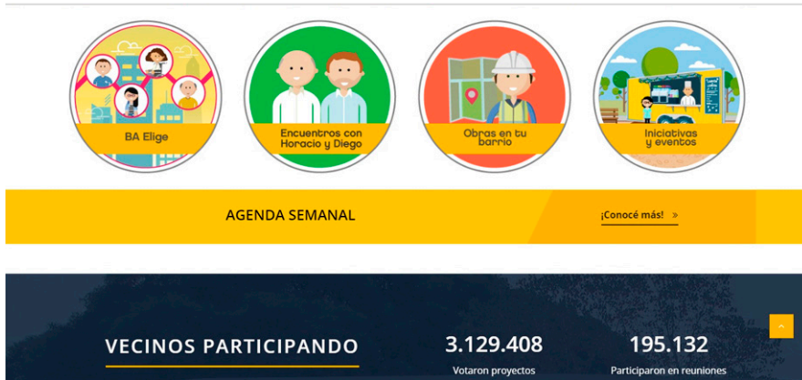
Figura 2. Página de inicio del sitio web de Buenos Aires Participación Ciudadana.