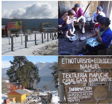
Figura 2. Imágenes Icalma Bricolage Turístico

Del conjunto de estos agentes económicos indígenas, algunos parecían responder a la lógica convencional del pequeño emprendimiento rural bajo condiciones neoliberales, motivado por las nuevas oportunidades económicas, tanto en los mercados como en la oferta pública de instrumentos de desarrollo local. Algunos de estos actores, buscaban captar los flujos estacionales de un creciente turismo de masas, mediante la instalación de campings en sus terrenos a orillas del lago. Otros (hasta ese momento, los menos) optaban por reditar el traspaso de sus parcelas a agentes exógenos para su desarrollo inmobiliario y comercial 4 .